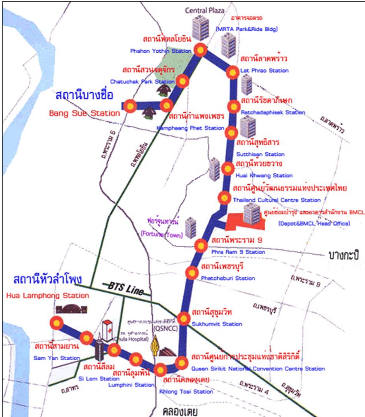
รูปที่ 1.3-1 แผนที่ตั้งรถไฟฟ้ามหานคร สายเฉลิมรัชมงคล (สายสีน้ำเงิน ช่วงหัวลำโพง-บางซื่อ)

อยู่ที่หัวถนนพระรามที่ 4 บริเวณจุดตัดหัวถนนรองเมืองและถนนมหาพฤฒาราม หน้าสถานีรถไฟหัวลำโพง มีขนาดสถานีกว้าง 23 เมตร ยาว 206 เมตร ระดับชานชาลาอยู่ลึก 14 เมตรจากผิวดิน โครงสร้างสถานีมี 2 ชั้น เป็นชานชาลาแบบต่างระดับ ทางเข้า-ออก มีทั้งหมด 4 จุด คือ บริเวณด้านหน้าสถานีรถไฟหัวลำโพง ด้านหน้าอาคารตั้งอ่าวปัก ด้านหน้าธนาคารกรุงเทพ และฝั่งด้านหน้าโรงแรมบางกอกเซ็นเตอร์