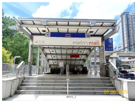
สถานีเพชรบุรี (PET)