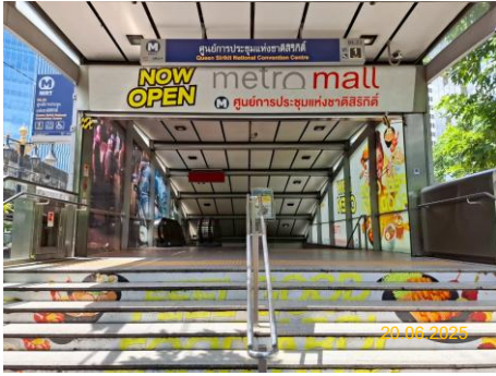
สถานีศูนย์การประชุมแห่งชาติสิริกิติ์ (SIR)