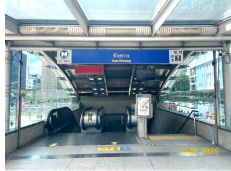
สถานีหัวขวาง (HUI)