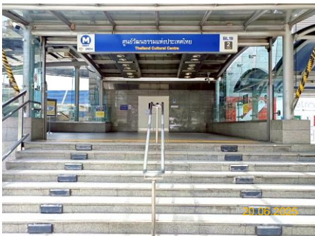
สถานีศูนย์วัฒนธรรมแห่งประเทศไทย (CUL)