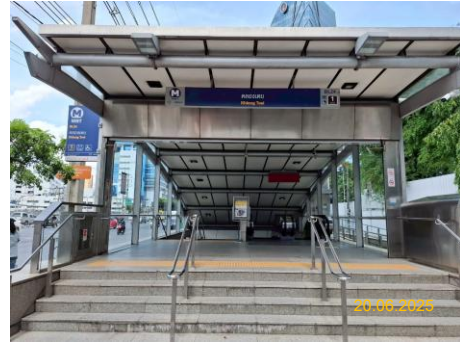
สถานีคลองเตย (KHO)