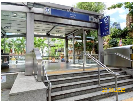
สถานีสามย่าน (SAM)