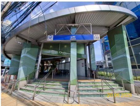
สถานีลุมพินี (LUM)