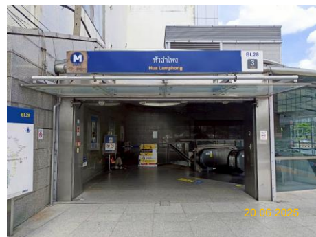
สถานีหัวลำโพง (HUA)

ภาพที่ 1.5-1 (ต่อ) สภาพการดำเนินโครงการในช่วงเดือนมกราคม-มิถุนายน 2568