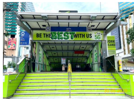
สถานีสุขุมวิท (SUK)

ภาพที่ 1.5-1 (ต่อ) สภาพการดำเนินโครงการในช่วงเดือนมกราคม-มิถุนายน 2568