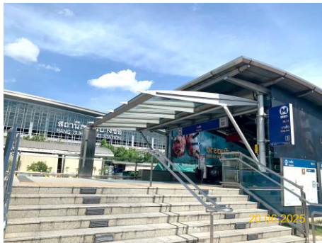
สถานีบางซื่อ (BAN)

บริษัท ทางด่วนและรถไฟฟ้ากรุงเทพ จำกัด (มหาชน) ได้รับสัมปทานสำหรับการลงทุน จัดหาระบบรถไฟฟ้า และการให้บริการเดินรถไฟฟ้า ช่วงสถานีบางซื่อถึงสถานีหัวลำโพง จากการรถไฟฟ้าขนส่งมวลชนแห่งประเทศไทย (รฟม.) โดยเริ่มเปิดให้บริการเดินรถไฟฟ้าเมื่อวันที่ 3 กรกฎาคม 2547 สำหรับการดำเนินโครงการในช่วงเดือน มกราคม-มิถุนายน 2568 มีสถานีรถไฟฟ้าทั้งหมด 18 สถานี และศูนย์ซ่อมบำรุง จำนวน 1 แห่ง (ภาพที่ 1.5-1)