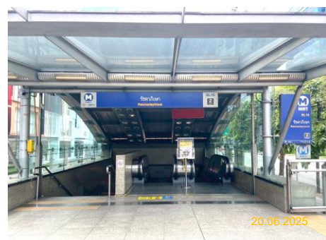
สถานีรัชดาภิเษก (RAT)