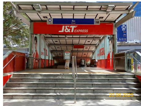
สถานีสีลม (SIL)