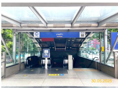
สถานีลาดพร้าว (LAT)