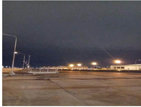
ศูนย์ซ่อมบำรุง

ภาพที่ 1.5-1 (ต่อ) สภาพการดำเนินโครงการในช่วงเดือนมกราคม-มิถุนายน 2568