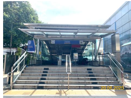
สถานีกำแพงเพชร (KAM)