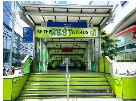
สถานีพระรามเก้า (RAM)