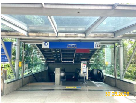
สถานีสวนจตุจักร (CHA)