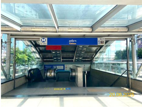
สถานีสุทธิสาร (SUT)